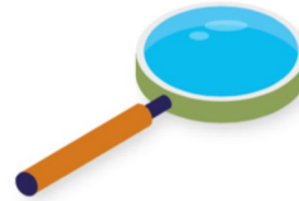
WISSENSANEIGNUNG UND VERARBEITUNG